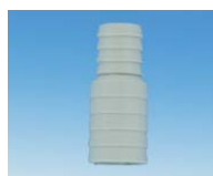
Schlauchstutzen / hose clip C1.0608.02