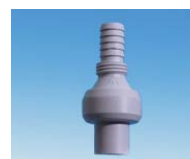
Rückschlagventil / non-return-valve 3004.02.00