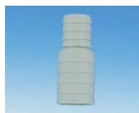
Schlauchstutzen / hose clip C1.0608.02