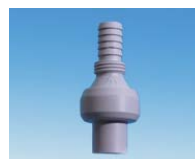
Rückschlagventil / non-return-valve 3004.02.00