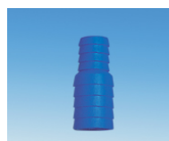
Entlüftungsstutzen / vent connection C1.0605.01