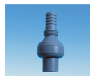
Rückschlagventil mit Entlüftung / non- return-valve with venting 3004.53.00