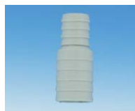
Schlauchstutzen / hose clip C1.0608.02