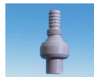
Rückschlagventil / non-return-valve 3004.02.00